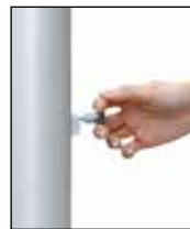
Entsperrstift ziehen, Riegel nach unten schieben: ENTSICHERN

Das patentierte Kurbel-Hissystem alfa FlagLift® besteht aus dem Kompaktantrieb mit VA-Antriebsrad, dem VA-Hissseil und dem Langschlitten mit Federvorspannung. Alle Bauteile befinden sich in der Mastnut. Die Seilarretierung wird durch eine Federbremse bewirkt, die durch einfaches Anheben des Sicherungsriegels das Antriebsrad blockiert und den Steckerzug für die Handkurbel verschleißt. Die Entriegelung erfolgt mittels eines Spezial-Entsperrstiftes in einem Handgriff.