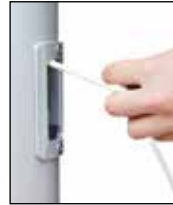
Hissen der Fahne durch horizontales Ziehen, Einholen durch Loslassen.

Die klassische Innenseilführung mit dem im Mastrohr laufenden PES-Hissseil. Die Handhabung des Hissseiles erfolgt über das Bediengehäuse mit (SchnellFixierSystem) alfa-SFS mit sperrbarem Türchen. Hissen und Abnehmen der Fahnen erfolgt durch Ziehen bzw. Nachlassen des Hissseiles. Bei Loslassen arretiert das Hissseil selbsttätig in der Spezial-Seilklemme im SFS-Gehäuse.