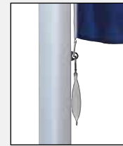
Untersten Karabiner – zusammen mit Fahnenstraffergewicht in Öse des untersten Fahnentuchhalters einhaken.