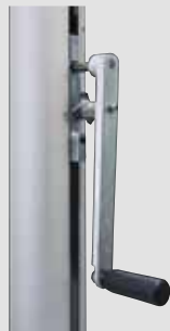
Kurbelhissvorrichtung alfa FlagLift® , Handkurbel