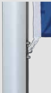
Zubehör: Fahnenstraffer, unverlierbar

5 Jahre Garantie auf Standicherheit der Mastrohre