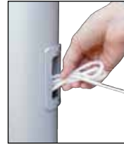
Nach dem Hissen Seil in Schlaufen legen und als Bund in das Bediengehäuse stecken.