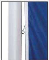
Mittleren Karabiner in die Ösen der Fahnentuchhalter einhaken.